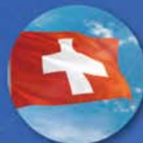
プライベートバンク