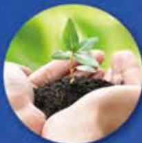
株式・投資信託・仕組債