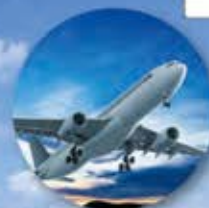
オペレーティングリース